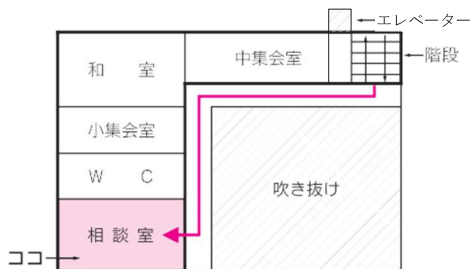
大学会館3階 (大学会館は生協食堂のある建物です)

大学会館北口（運動場側）付近の階段またはエレベーターで3階まで上り、廊下に沿って一番奥まで来てください。静かな、窓から見える緑のきれいなところですよ。